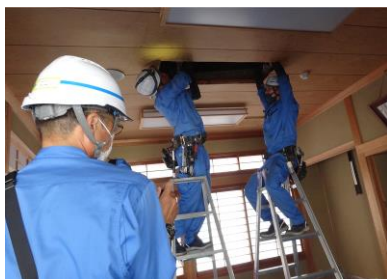
あっという間に快適温度！

「今までより消費電力も削減でき、暑い日も寒い日もしっかりと運転！快適・省エネ空調を実現できると思います」