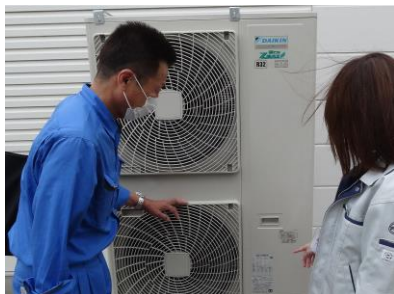
音も静かでバッチリ省エネ